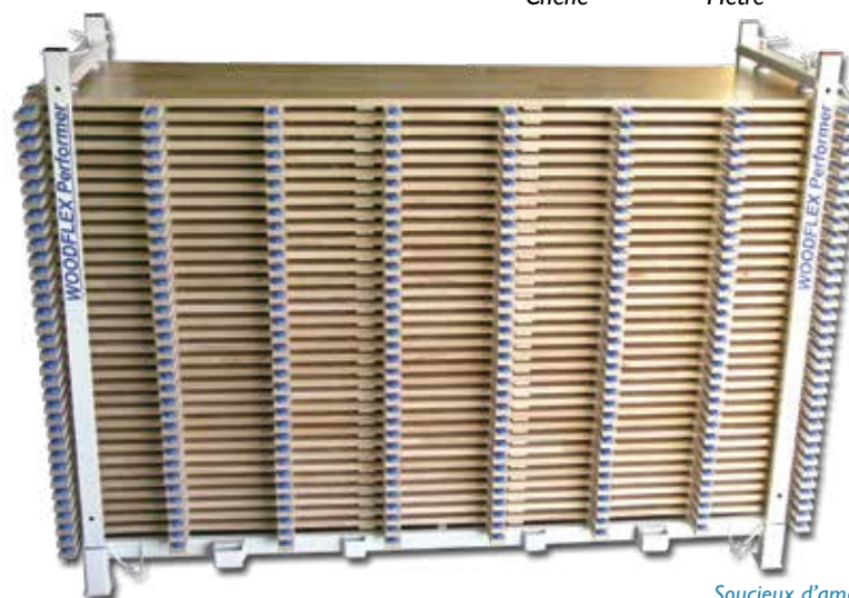
Rack de stockage sécurisé Possibilité roues intégrées (en option)

Soucieux d'améliorer les performances de nos systèmes sportifs, les données contenues dans le présent document sont fournies à titre indicatif. Systèmes brevetés.